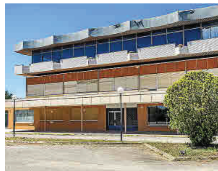
(Arriba) Yanko supuso un hito en la arquitectura industrial de Inca.