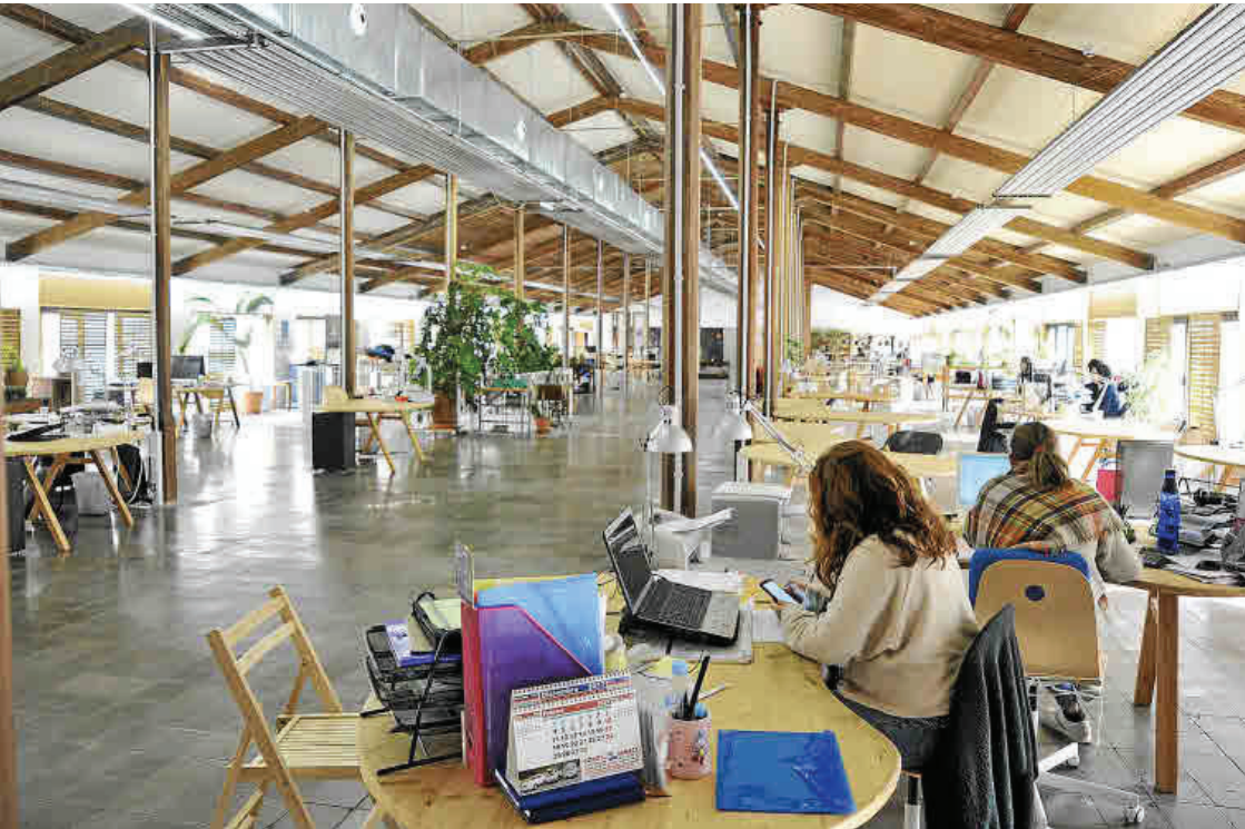
La década de los 20 vio cómo se construía el que aún hoy es uno de los espacios más emblemáticos de la ciudad, la Fábrica Ramis. Su rehabilitación trató de conservar al máximo su carácter, dotándolo de modernos servicios.