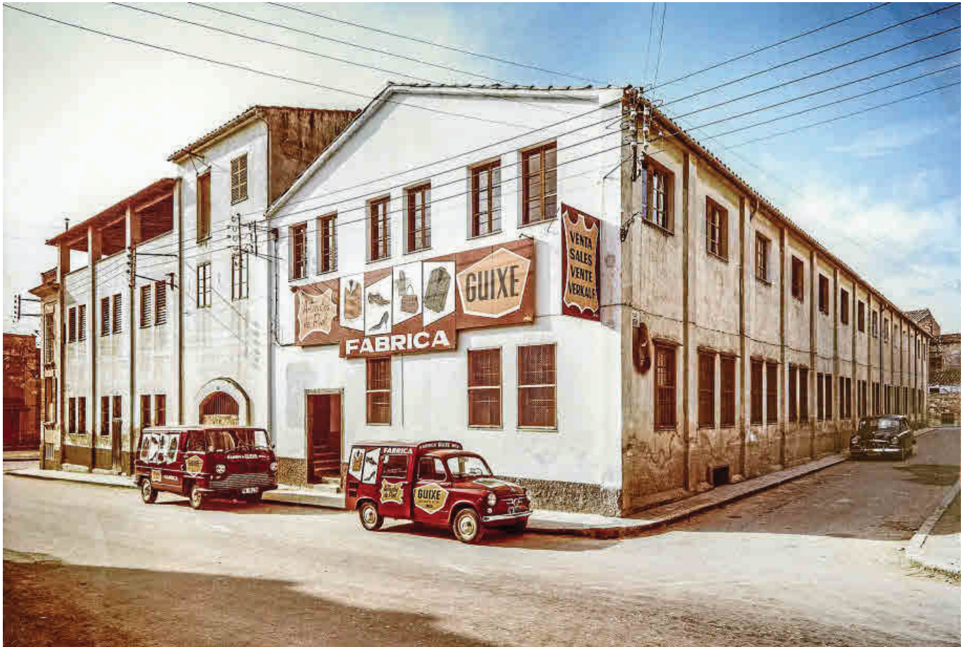
Cas Català sufrió un derrumbe en 1930 en el que murieron dos trabajadores. A la derecha Can Pujol. Ambos edificios desaparecieron hace décadas.

ban la piel y esta industria produciría el cambio más profundo que la ciudad ha sufrido en toda su historia.