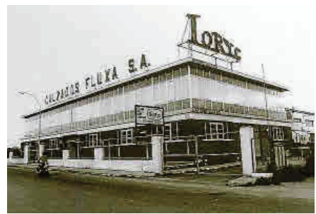
(Abajo) Este conocido supermercado aún es mencionado por su nombre original, Loryc.