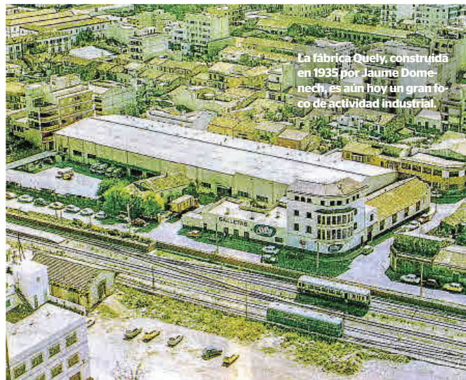
La fábrica Quely, construida en 1935 por Jaume Domech, es aún hoy un gran foco de actividad industrial.

nante. Se construyeron fábricas emblemáticas como las de Fluxà, una de las primeras como tal, diseñada por Guillem Reynés en 1911; Lottusse, Beltran, Gelabert, en la carretera de Lloseta; Can Payeras o Can Pujol en la Gran Via Colom; Can Noguera en lo que es ahora Plaça Llibertat; Loryc y Yanko, en la carretera de Binissalem. Esta última, dada su magnitud, fue un hito en su época. Son grandes fábricas que propiciaron una actividad frenética en el municipio. Pero también a su alrededor aparecieron multitud de edificios complementarios o viviendas particulares de importancia arquitectónica. Son ejemplo de ello el Teatre Principal, el Cine Mercantil, o casales como los de Can Mir. El modernismo no tuvo una popularidad es-