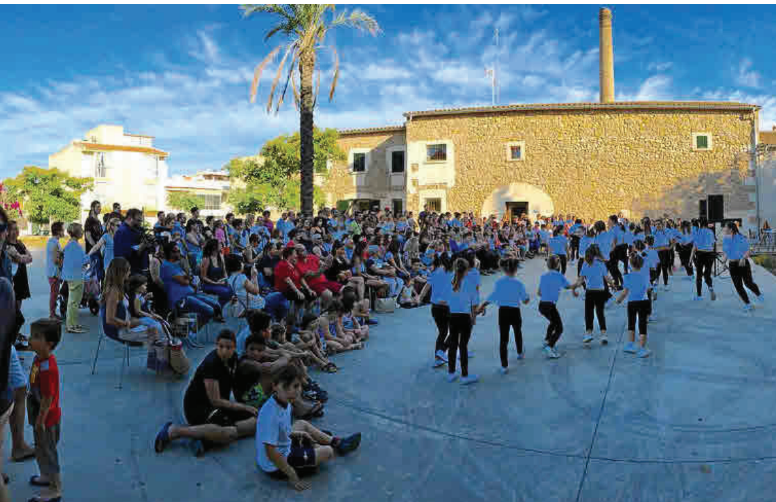
(Izquierda) Las actividades organizadas en el Casal de Joves, antigua fábrica de hielo, han dado un nuevo sentido a este popular espacio.