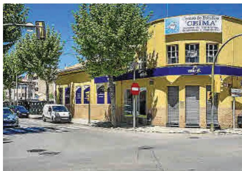
La fábrica Seguí sigue teniendo un uso comercial, aunque muy distinto del original.

ALGUNOS ESPACIOS, COMO LA FÁBRICA RAMIS O EL CASAL DE JOVES, SON EJEMPLOS DE RECUPERACIÓN